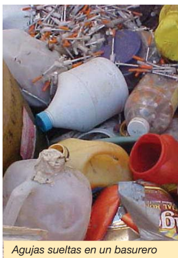
Agujas sueltas en un basurero

Todas las agujas deben tratarse como si fueran portadoras de una enfermedad. Eso significa que si alguien se pincha accidentalmente con una aguja, tiene que hacerse análisis médicos costosos y preocuparse de si ha contraído o no una enfermedad grave o mortal. Emplee métodos seguros al descartar las agujas usadas y evite así exponer al peligro a otras personas.